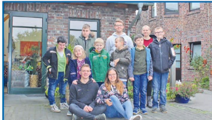
Den Alltag einfach mal hinter sich lassen und die Freizeit genießen.