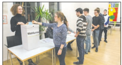
Viel Andrang bei der Juniorwahl