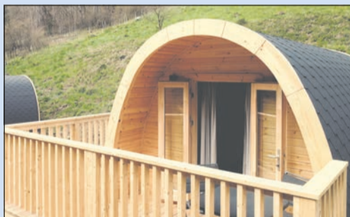
Die neuen Luxus-Lodges ...

Idyllisch in einem der grünen Täler des Frankenwaldes gelegen, warten „Sepp“ und „Traudl“ auf