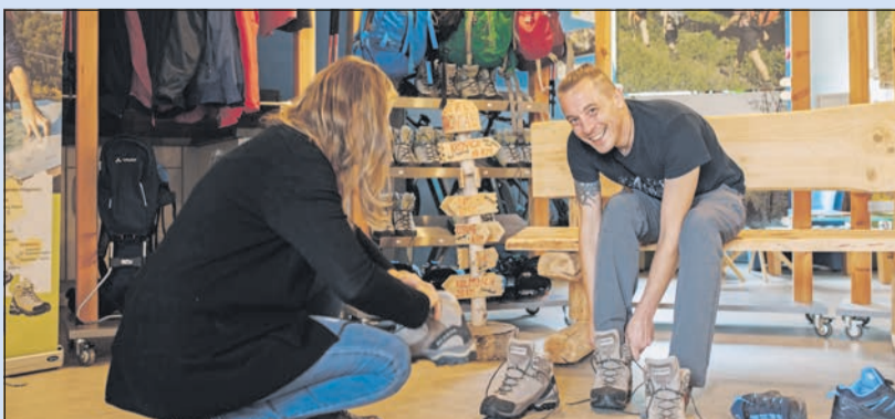
Best of Wandern-Testcenter im Frankenwald

ihre Gäste. Die beiden Luxus-Lodges fügen sich harmonisch in die Landschaft ein und überzeugen durch ihre naturnahe Bauweise und die verwendeten Materialien. Auf 18 m 2 gibt es eine Küchenzeile, ein Doppelbett, Bad mit Dusche und