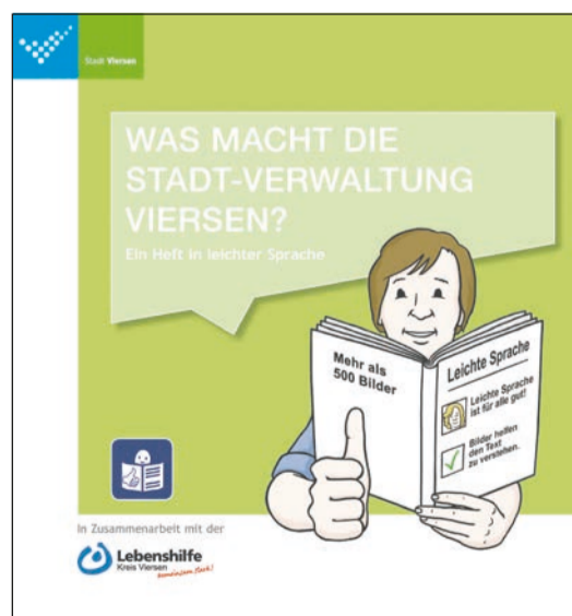
Die neue Broschüre „Was macht die Stadt-Verwaltung Viersen?“

Menschen mit Lernschwierigkeiten, Menschen mit kognitiven Beeinträchtigungen, Menschen, die nicht gut lesen können oder für die Deutsch eine Fremdsprache ist, sollen mit dieser Broschüre Unterstützung bekommen. Zum anderen wurde gemeinsam