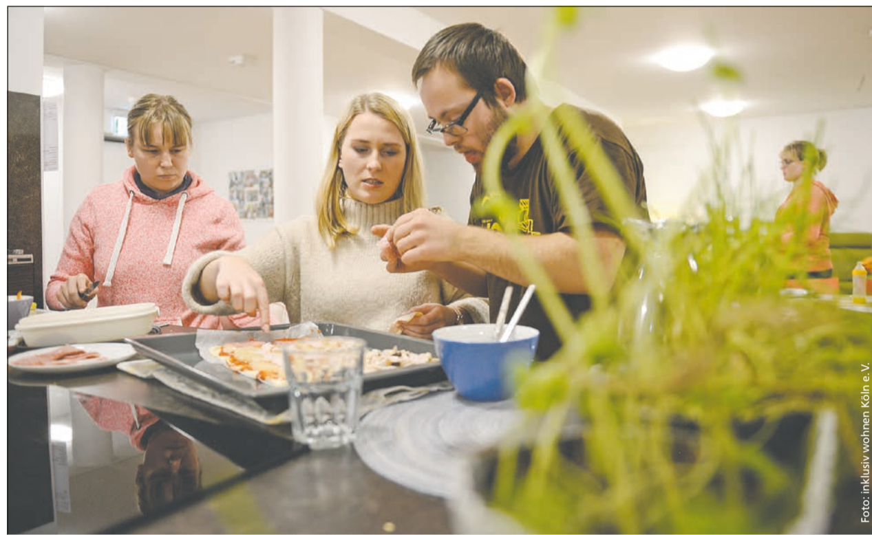
Gemeinsam gut zusammenleben: Studierende und Menschen mit Behinderung im neuen Wohnprojekt

Professionell, kreativ und innovativ – neues inklusives Wohnprojekt mit Vorbildcharakter