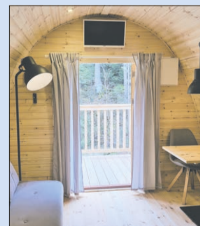
... Sepp und Traudl

Gewinnen Sie zwei Übernachtungen in der Luxuslodge „Sepp“ oder „Traudl“ in der Best of Wandern-Region Frankenwald inklusive WLAN, Sat-TV, Nebenkosten und Endreinigung im Wert von 180 Euro.