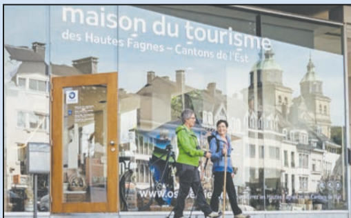
Gut ausgerüstet geht's auf Tour.

gewonnen. Die Lebenshilfe Journal-Redaktion gratuliert dem Gewinner sehr herzlich. Der Gutschein wird per Post zugestellt. Zu diesem Zweck werden die Adressdaten einmalig dem Hotel/der Region zum Versand übermittelt.