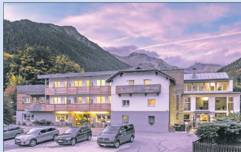
Das Hotel Bergkristall