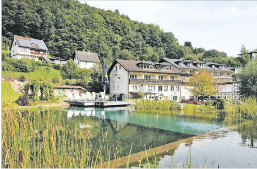
Drei-Sterne Hotel Christel im Herzen des Spessarts