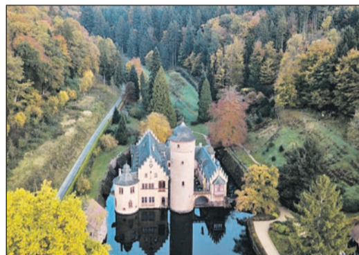
Wasserschloss Mespelbrunn

eine Gruppe. Ich denke, dass das Hotel auch für Rollstuhlfahrer geeignet ist. Auf jeden Fall erst einmal vielen Dank für die schöne Zeit im Räuberland.“ vw