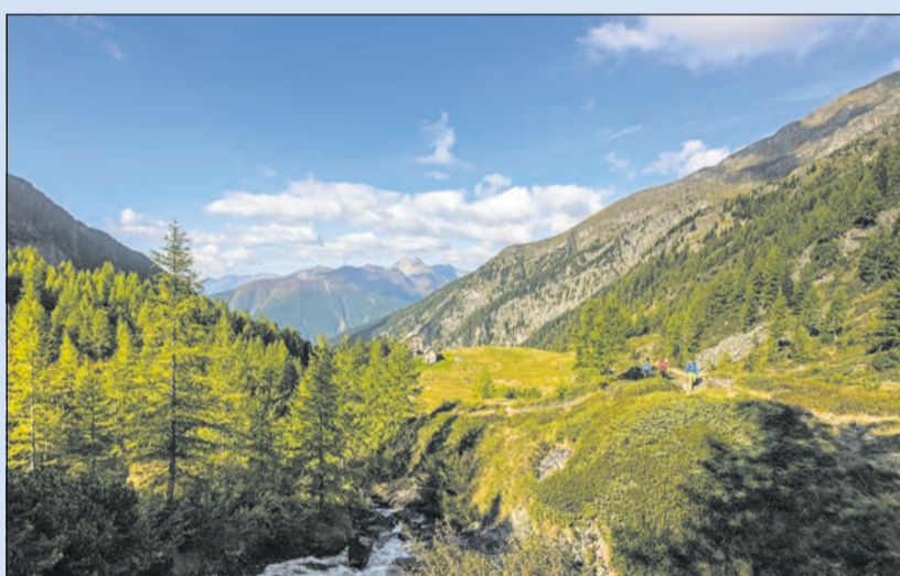
Unverfälschtes Naturerlebnis im Nationalpark

Gewinnen Sie zwei Übernachtungen für zwei Personen im Doppelzimmer inkl. Halbpension im Wert