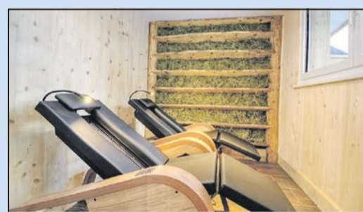
Wellness-Oase im Hotel Bergkristall

Wandergäste können im Best of Wandern-Testcenter im Besucherzentrum des Nationalparks in Mallnitz einen besonderen Service nutzen und Wanderausrüstung für einen Tag kostenfrei ausleihen und auf Tour testen. Alle Infos unter www.best-of-wandern.de