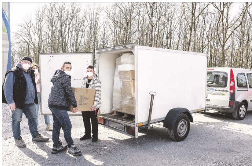
Die Hilfsgüter werden am Wochenende durch die Organisation „Mensch zu Mensch“ in die Ukraine transportiert.