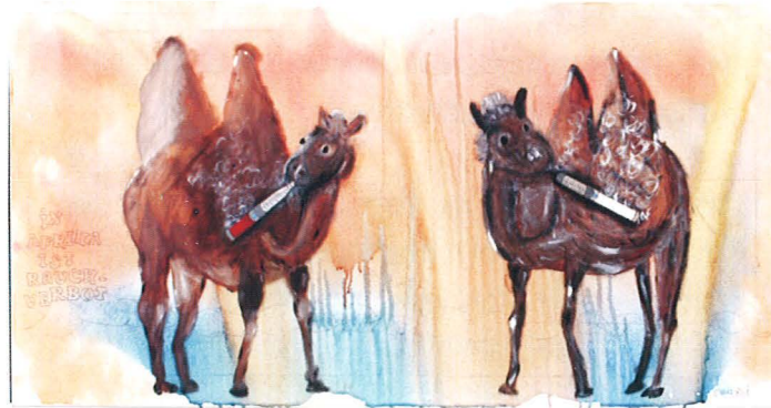
„In Afrika ist Rauchverbot“ Rosi E. 2012 Acryl auf Baumwolle 50 x 100 cm

Mit wechselnder Beteiligung der 14 Personen in der Kunstgruppe entstehen Werke aus der Phantasie der Künstler. Es entstehen hochinteressante Welten, die dem Betrachter bei den öffentlichen Ausstellungen eine Vielfalt an Interpretationen bieten und zu hohem Zuspruch für die Künstler führen.