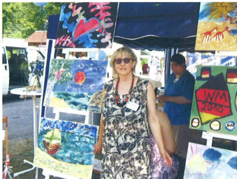
Ausstellung im Pavillon in Nettetal...

Hier im Atelier werden Ideen entwickelt und umgesetzt. Die fertigen Werke werden dann in regelmäßigen Ausstellungen der Öffentlichkeit gezeigt und entwickeln einen anregenden Dialog mit den Betrachtern. Die Künstler erklären voller Stolz ihre Bilder und stehen damit im Mittelpunkt des Geschehens.