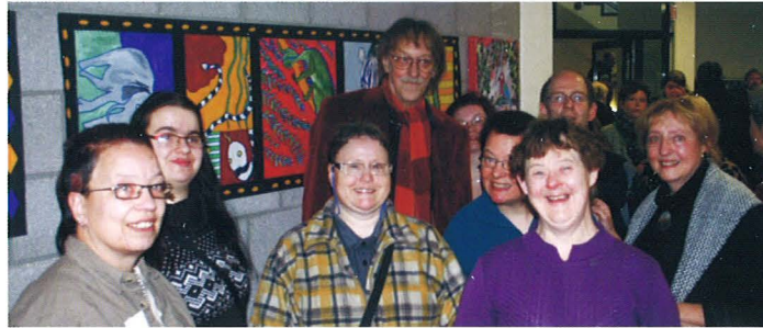
Vernissage der „Afrika I - Ausstellung“ im Rathaus der Stadt Nettetal

Mit wechselnder Beteiligung der 14 Personen in der Kunstgruppe entstehen Werke aus der Phantasie der Künstler. Es entstehen hochinteressante Welten, die dem Betrachter bei den öffentlichen Ausstellungen eine Vielfalt an Interpretationen bieten und zu hohem Zuspruch für die Künstler führen.