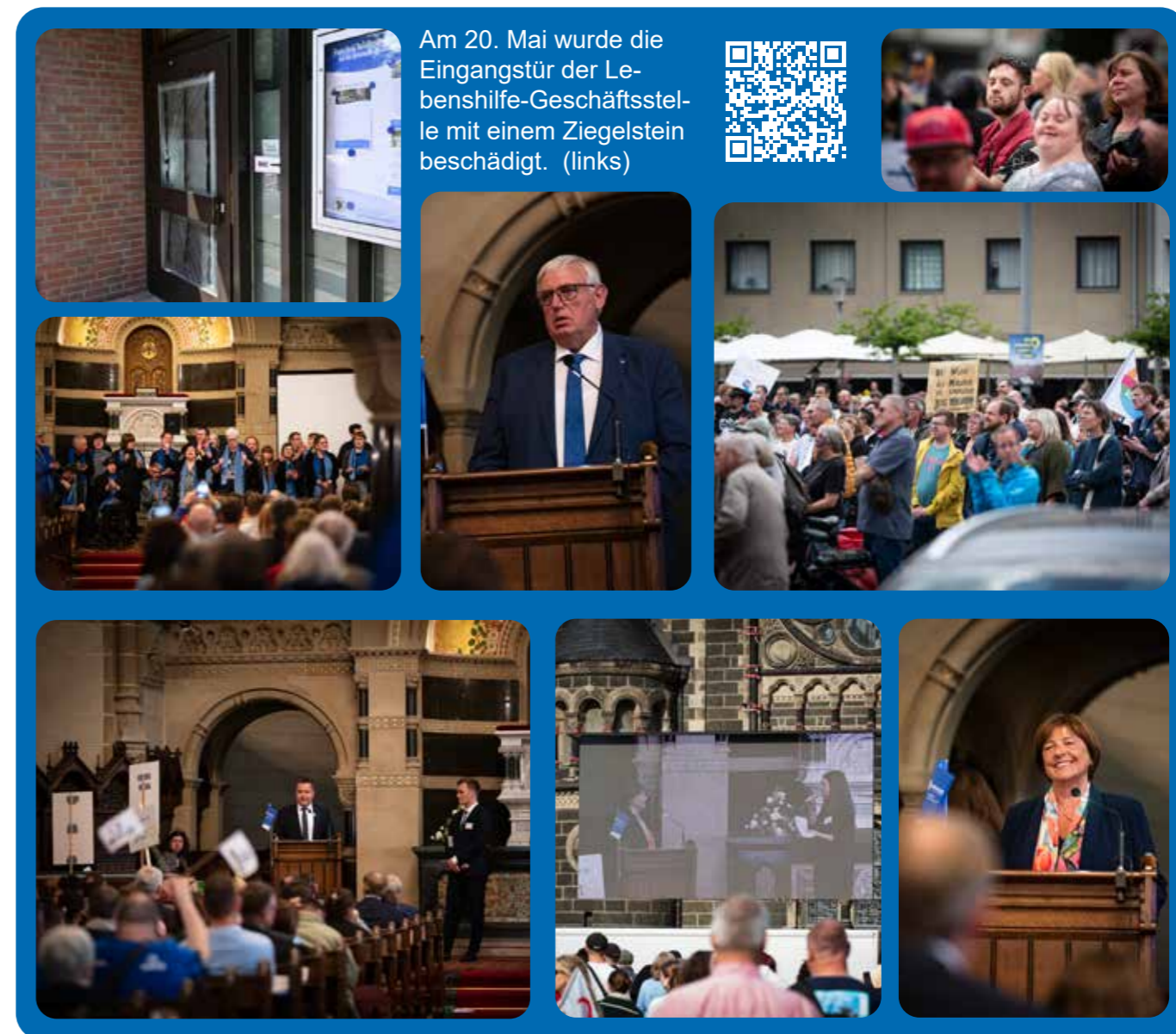
Am 20. Mai wurde die Eingangstür der Lebenshilfe-Geschäftsstelle mit einem Ziegelstein beschädigt. (links)