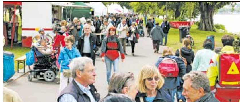
Viel los beim bunten und inklusiven Familienfest

„Wir alle möchten mit diesem bunten Fest zeigen, wie Inklusion funktionieren kann. Im Rheinland