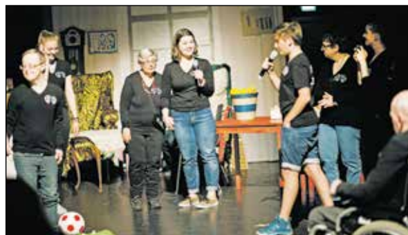
Der Besuch der Enkel startete bei Kaffee und Kuchen.

Ein Jahr hatte man jeden Mittwoch in den Räumen des Gymnasiums geprobt. Das Miteinander begann damit, dass die Schüler die Menschen mit Behinderung in der