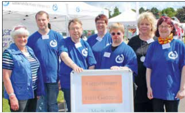
Zahlreiche Mitmach-Aktionen an den Ständen der Lebenshilfe Oberhausen (o. l./Karaoke), der Lebenshilfe Kreis Viersen (o. r./Malen) und der Lebenshilfe NRW (u. l./eine Form des Malens). Der Lebenshilfe Rat Kreis Viersen war auch dabei (u. r.).