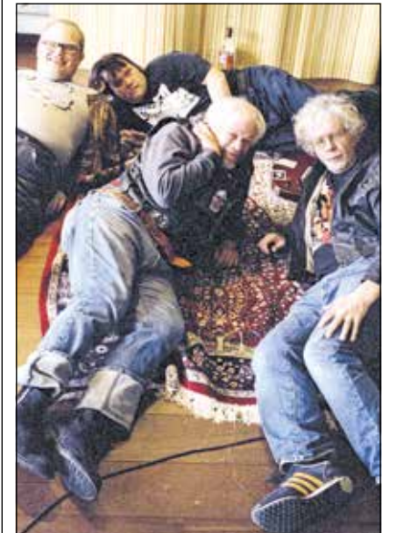
Die Punkband PKN

Drei der Mitglieder von PKN haben das Down-Syndrom, einer ist Autist. Zusammen sind sie eine waschechte Punkband. Texte über soziale Probleme passen, das Bier in der Hand haut hin und auch die Jeansknoten voller Band-Aufnäher sind stimmig.